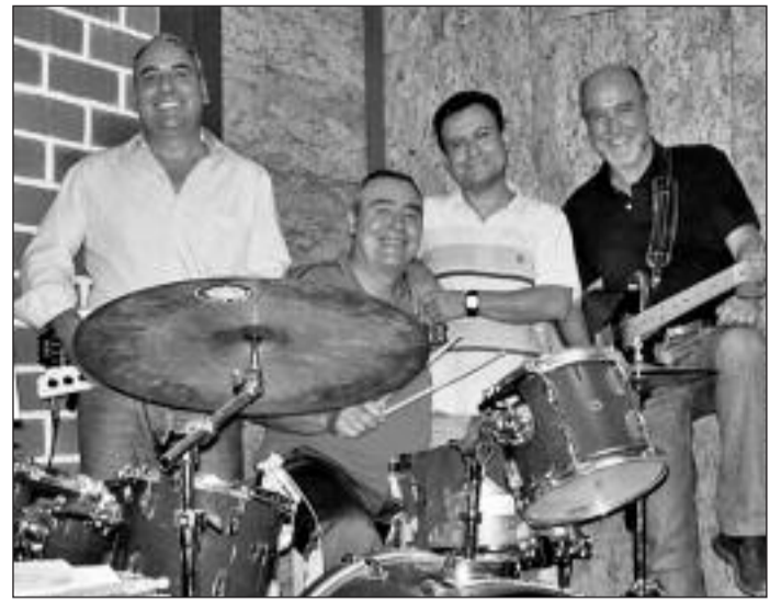
Los Centauros tras su reunificación y regreso a la escena

Pompirock se celebra mañana sábado, día 30, a las 23 horas en la Casa de Cultura de Manzanera.